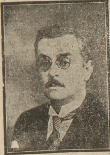
İktisat vekili Mahmut Celâl bey

Bursa 16 "A. A." - İktisat Vekili Celâl Bey dün İzmir Valisi Kâzım paşa ile birlikte Orhaneline giderek tetkikatta bulduktan sonra Bursaya dönmüşlerdir.